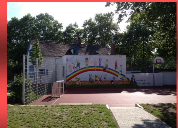
Die Fassade der „ISGA“ ist längst ein Markenzeichen für das St. Antoniusheim

Intensive soziale Gruppenarbeit - „ISGA“