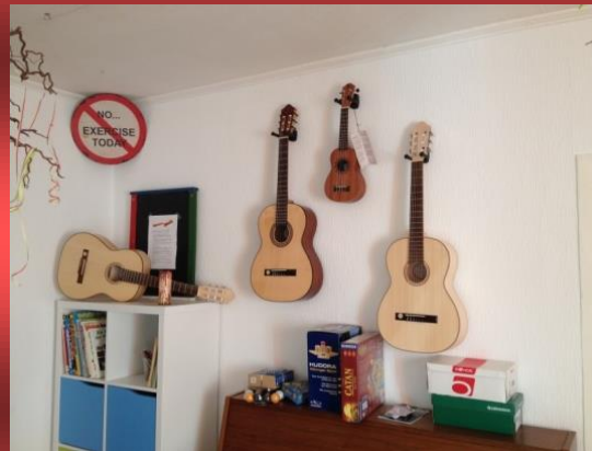
In der Gitarren-AG wird gerockt