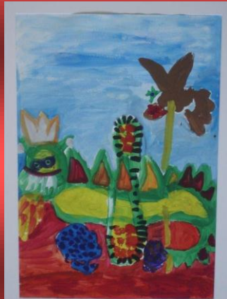
Ein Bild aus der Ausstellung der Kunsttherapie

TERMIN: 18. SEPTEMBER 2012 - 16 Uhr: Vernissage zur Ausstellung von Bildern aus der Kunsttherapie des St. Antoniusheims in den Räumen der Stadtwerke, Kaiserstraße 182