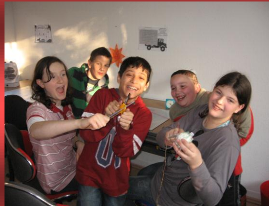
Spaß in der Sozialen Gruppenarbeit