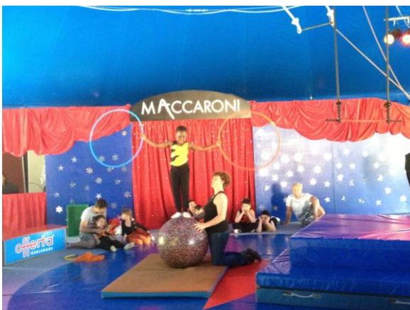
Höhepunkt ist die eigene Zirkusvorstellung im Zirkuszelt beim Kinderzirkus Maccaroni.

Dies sind nur drei Beispiele besonderer Angebote, die wir mit der Unterstützung durch Spenden oder Gerichtsauflagen finanzieren können.