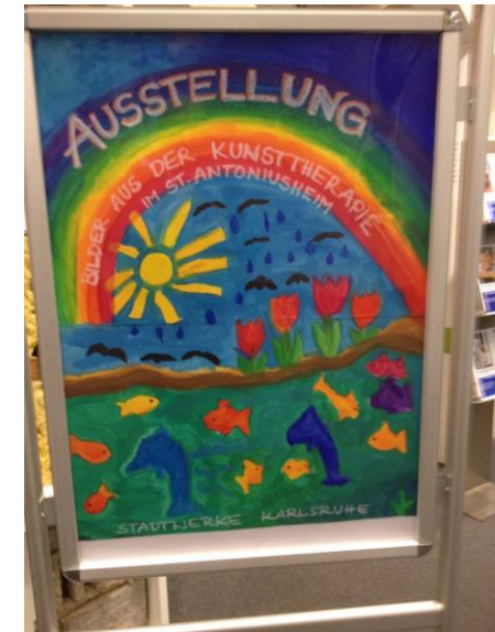
Ausstellung bei den Stadtwerken 2015

Das St. Antoniusheim führte im Herbst 2015 eine Ausstellung mit Bildern aus der Kunsttherapie der Kinder durch und plant dies auch für 2016.