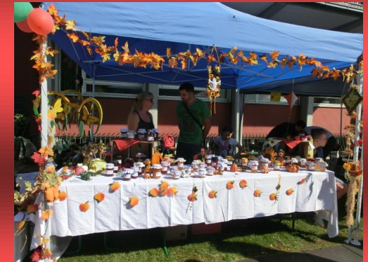
Der „Fuchsbau-Stand“ beim Herbstfest

Wir nehmen Kinder bis zum 12. Lebensjahr auf und betreuen diese so lange wie nötig. Voraussetzung ist eine längerfristige Notwendigkeit einer vollstationären Hilfe zur Erziehung