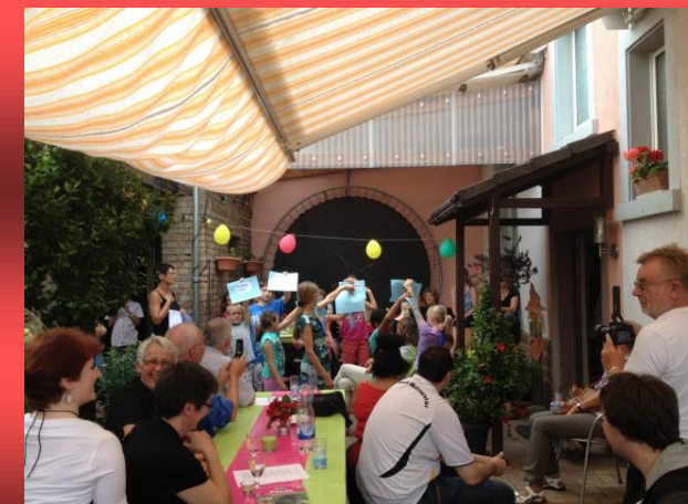
Großes Fest im Kinderhaus Fuchsbau

Kinderhäuser „Finkennest“, Fuchsbau“ und „Lummerland“