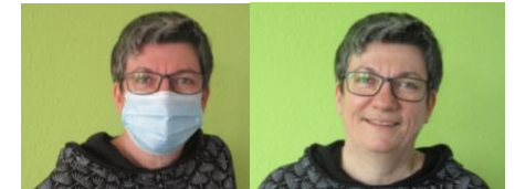
Auch für unsere Beschwerdebeauftragte gilt im Umgang mit unseren Kindern: Maskenpflicht

Auch herrscht seit Beginn dieses Jahres per Verordnung eine generelle Pflicht zum Tragen eines medizinischen Mund-Nasen-Schutzes oder einer FFP2-Maske für alle Mitarbeiter*Innen unserer Einrichtung. Ausnahmen gibt es nur in bestimmten Situationen des Arbeitsalltags, die genau definiert sind.