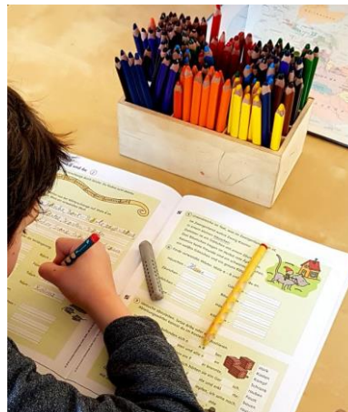
Homeschooling, mal mit, mal ohne Laptop

Im Schuljahr 2020/21 war es bisher leider die meiste Zeit nötig, dass wir auf Grund der Schulschließungen vormittags eine alternative Betreuung unserer Kinder als Homeschooling durchführen mussten.